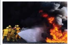
ฝึกดับเพลิงขั้นสูง (นอกอาคาร)