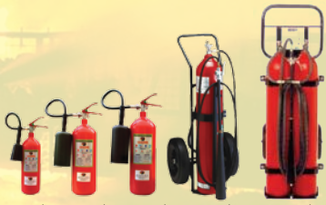
5 ปอนด์ 10 ปอนด์ 15 ปอนด์ 50 ปอนด์ 100 ปอนด์