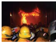
ฝึกดับเพลิงขั้นสูง (ในอาคาร)