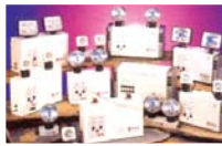
AUTOMATIC EMERGENCY LIGHT AND EXIT SIGN LIGHT (เครื่องไฟฉุกเฉินอัตโนมัติ และป้ายทางออกฉุกเฉินทุกชนิด)