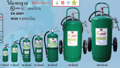
2 ปอนด์ 5 ปอนด์ 10 ปอนด์ 15 ปอนด์ 20 ปอนด์ 50 ปอนด์ 100 ปอนด์