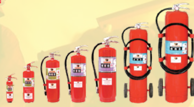
2 ปอนด์ 5 ปอนด์ 10 ปอนด์ 15 ปอนด์ 20 ปอนด์ 50 ปอนด์ 100 ปอนด์